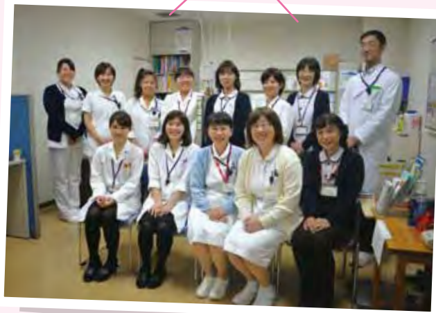
医療福祉サポートセンターの皆さん

師・栄養士がそれぞれの専門分野を担当し、利用者の皆さんの心に寄り添う気持ちを忘れずに相談に応じています。何かお困りのことがありましたら、お気軽にお声がけください。