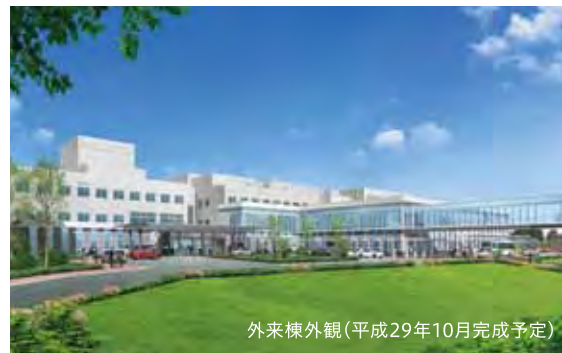
外来棟外観(平成29年10月完成予定)