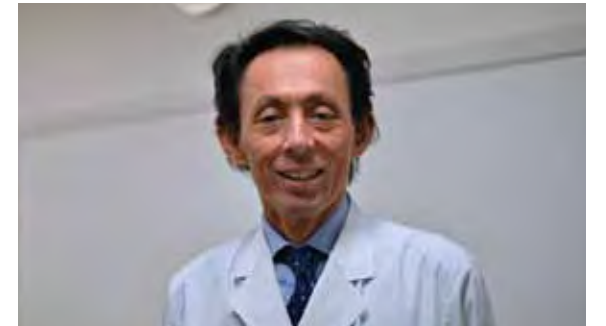
ひとりでも多くの皆さんにこころの健康のことを知ってほしい

厚生労働省は2011年に、従来の「4大疾病」(がん、脳卒中、急性心筋梗塞、糖尿病)に精神疾患を加えて、「5大疾病」とすることを決めました。その背景には、精神科を受診する患者数の急激な増加があり、精神疾患は「社会全体で取り組むべき国民病」とも言われています。このような重大な課題に対して、私たちが目指すべき重要ポイントは、早期診断です。一人ひとりの患者さんに合った治療をしっかりと考え、治療の副作用も最小化します。それらの実現には、医師、看護師、