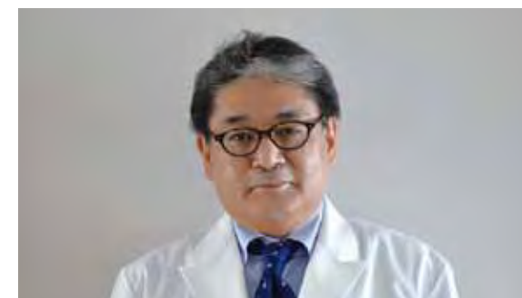
チーム医療で患者さんにとって最適な治療を行いたい

今年も糖尿病の治療をさらに進め、患者さんに少しでも安心して暮らせる毎日をお届けできるようにしたいと思います。