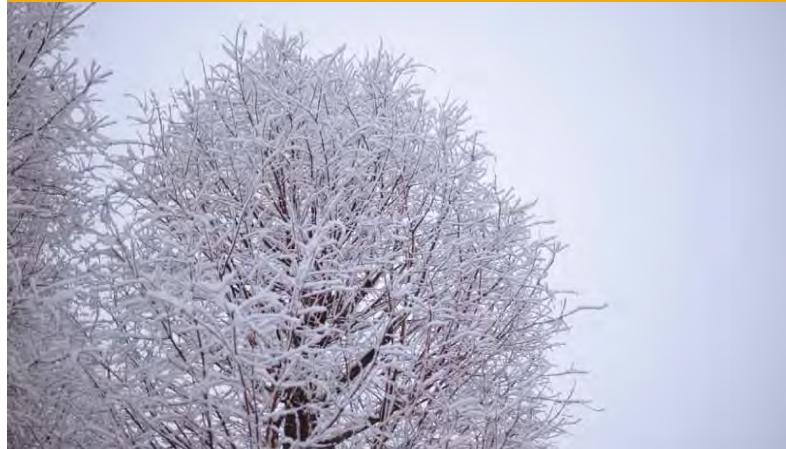
雪化粧したキャンパス内

富山大学附属病院 発行:富山大学附属病院 〒930-0194 富山市杉谷2630番地 076-434-2281(代表)