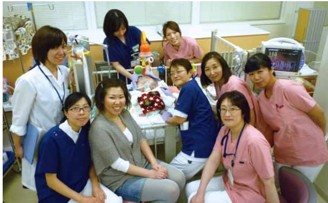
在宅でも安心できるサポート体制

自宅で暮らしながらも、安心していただくために、 それぞれの分野の専門職による支援体制が整っています。