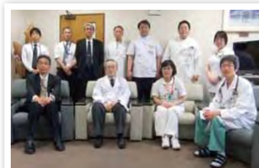
地域のために高度医療に挑戦する外山病院長とスタッフの皆さん