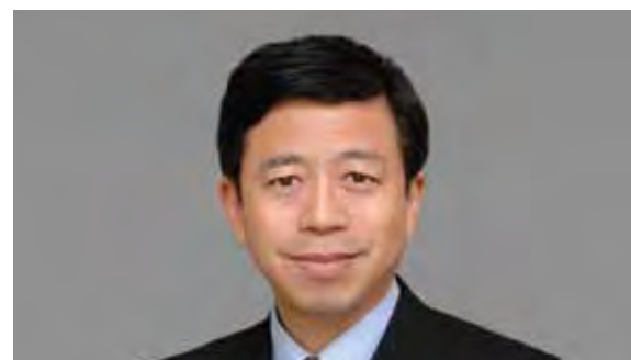
日々進歩する糖尿病治療を患者さんに届けたい

年末年始は、とかく食事をする機会が多くまた、天候の関係で運動も不足がちになります。糖尿病の治療の基本は、食事療法と運動療法ですので、忙しい毎日の中で工夫していただき、より良い血糖値のコントロールを目指してください。ヘモグロビンA1c(エーワンシー)という過去1~2ヶ月の血糖値の平均を示す数値が、7%未満であると血管合併症が進みにくいと言われております。最近の糖尿病の研究では、糖尿病の治療の開始は、早ければ早いほどその効果が大きいこと、また、たとえ合併症が進んだ状態で見つかったとしても血糖値・体重・血圧・脂質を正常化すると合併症が良くなる可能性があることがわかってきました。コントロールが良い状態の方はこれからも療養に励んで頂き、糖尿病の進行した合併症の状態で見つかったからでもしっかりと療養に努めてください。