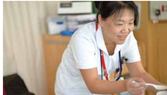
1日でも早く美味しく食事ができるようにサポートしたいと思います

摂食・嚥下(せつしょく・えんげ)とは、食物を認識して口に取り込み、嚥んで飲み込んで胃に至るまでの一連の流れです。摂食・嚥下障害は、口やのどの腫瘍・炎症、脳血管障害、筋・神経難病、加齢などによる嚥下機能の低下が原因としてあげられます。また、摂食・嚥下障害が新たな病気を招くこともあります。最近では口の中の不衛生から誤嚥した唾液が主な原因で起こる誤嚥性肺炎の患者さんも増えており、そのために口やのどの機能が低下しないよう、口の清潔・栄養面・食事の