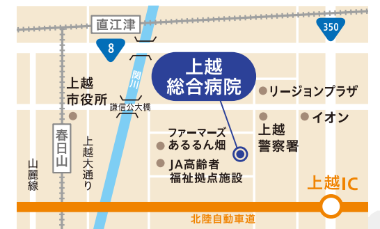
北陸自動車道 上越I.C.下車3分

[所在地] 新潟県上越市大道福田616番地 TEL.025-524-3000 FAX.025-524-3002 [休診日] 土曜・日曜・祝日 [診療科] 内科・神経内科・循環器内科・小児科・外科・乳腺外科・呼吸器外科・脳神経外科・産婦人科・耳鼻咽喉科・眼科・整形外科・皮膚科・泌尿器科・リハビリテーション科・放射線科・放射線治療科・麻酔科・救急科・歯科口腔外科 [病床] 318床(ドック5床含む)