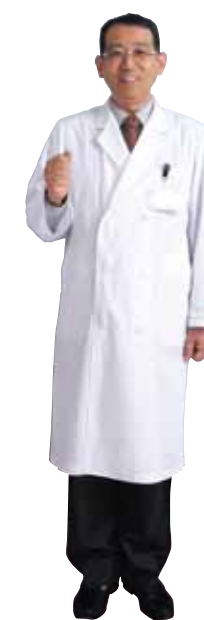
富山大学附属病院 病院長

希望を持つことが、良い未来を拓いていきます。そしてこの病院には希望ともいえる人材がたくさんいます。そこで、4月より臨床実習の医学科5年と6年の学生は全国共用試験通過者として認定しStudent Doctorという名札を下げた実習させていただくことになりました。病院内で多くの経験をすることで、将来の医療を担っていく若者たちが育ちます。あたたかくも厳しいご指導をお願いいたします。