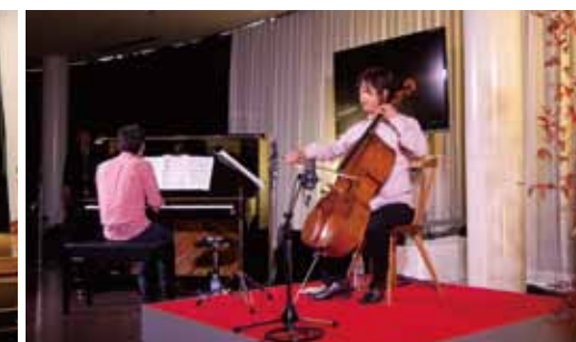
富山の皆さんに医療をより身近に感じていただくための市民公開講座と入院患者さんやご家族のための病院コンサートは今後も開催を予定しています