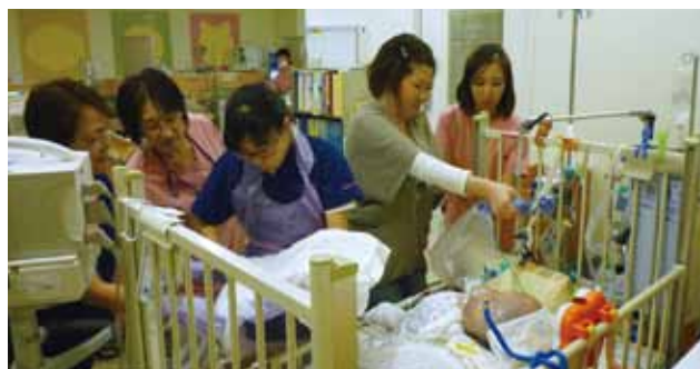
赤ちゃんの笑顔が見れるように