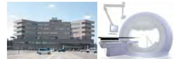
平成18年4月新築移転