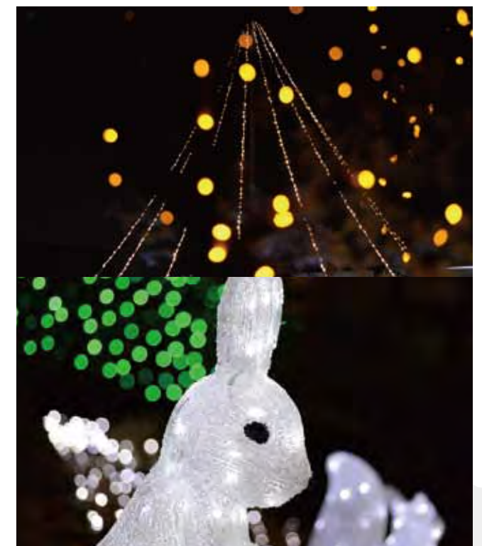
冬の間、患者さんの心を癒してくれる院内のイルミネーション