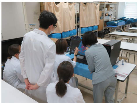
スキルスラボで体験会に参加。