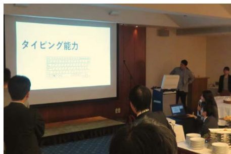
研修医 2年次による 「2年間で身についたこと」