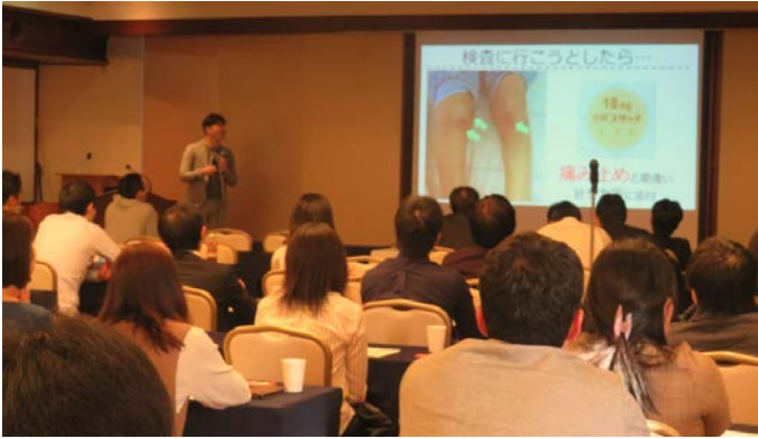
症例発表会の様子