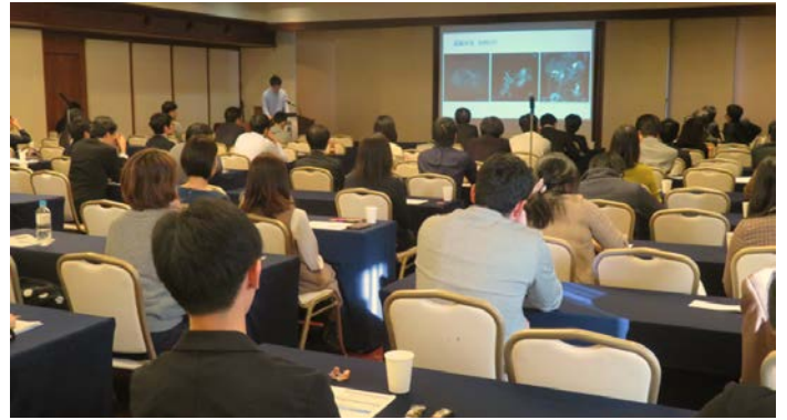
症例発表会の様子