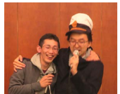
宇宙戦艦ヤマト熱唱