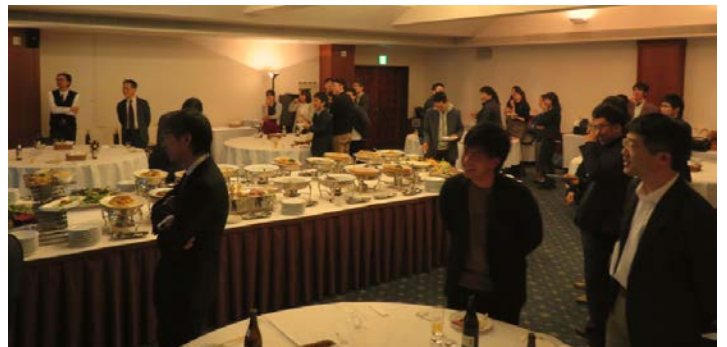
研修医のスライド上映を見入る参加者