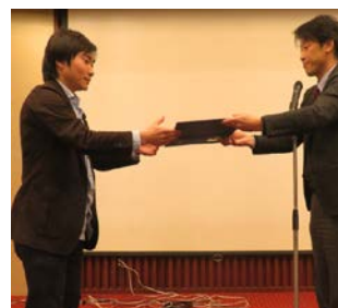
ベスト指導医賞 授与式