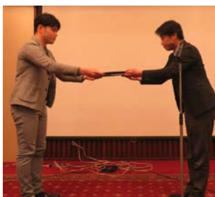
研修医 最優秀賞 授与式