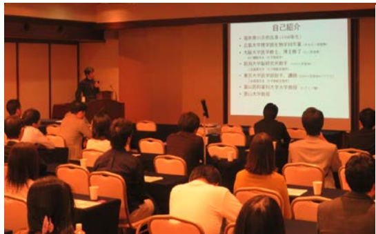
スキルアップセミナーを聴講する研修医