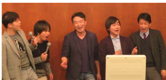
指導医、研修医が入り混じっての大合唱